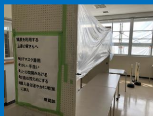
飛沫対策・食事も注意