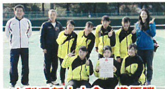
山梨県新人大会 準優勝