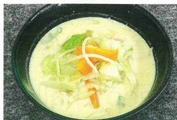
みそカレー牛乳みみ