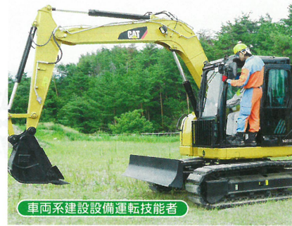
車両系建設設備運転技能者

スキルアップ! 本校生徒は「目指す仕事に就きたい」という夢をもって、系列で専門的な知識や技術・技能を学んでいます。その学んだことを実践的な能力にする方法として資格取得があります。資格は、社会に出てから、自分の能力を客観的に示す方法としても有効です。多くの可能性を秘めた皆さんが、積極的・主体的に資格取得にチャレンジすることは、モチベーションを高め、より幅広い能力を身に付けることにつながります。「スキルアップ」を合い言葉に、自分自身を成長させていきましょう。